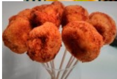
Chupa chups de piña y pollo