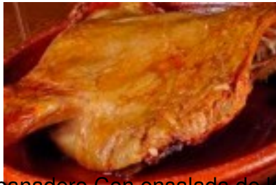
Lechazo asado en horno panadero Con ensalada de la huerta