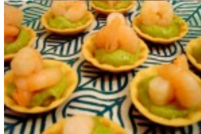
Tartaleta de aguacate y gambas