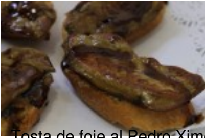
Tosta de foie al Pedro Ximénez