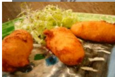
Croquetas caseras de boletus