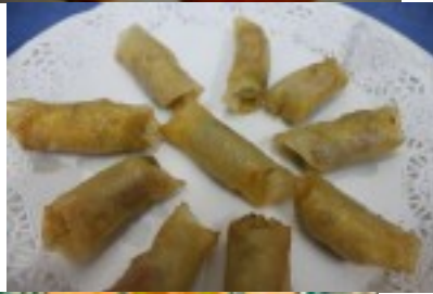
Crujientes de trigoero, bacon y queso