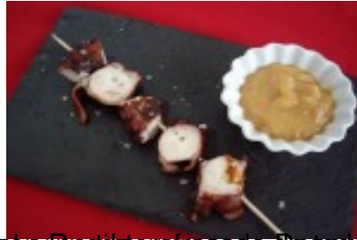
Brocheta de mulo a la gallega. Queso de mulo con salsa de gallego. Pañalito de miel con tomate de Galicia y @pyris de queso de la Capataz de Castilla,