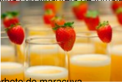
Sorbete de maracuya