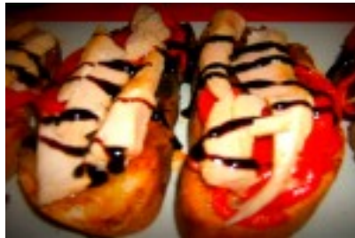
Tosta de pimientos asados con ventresca