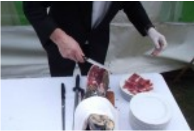
Jamón Ibérico de Bellota D.O. Guijuelo

El Menú Carrión comienza con el Cóctel, que consta de estos 8 aperitivos: