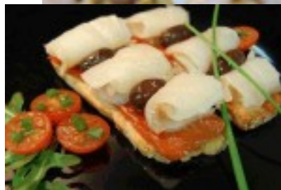
Tostas de brandada de bacalao