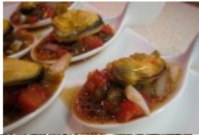
Cucharetas de mejillón con vinagreta