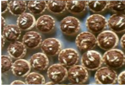
Volován de morcilla al piquillo y piñones