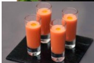
Chupito de gazpacho