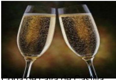
Copa de champán Fácil