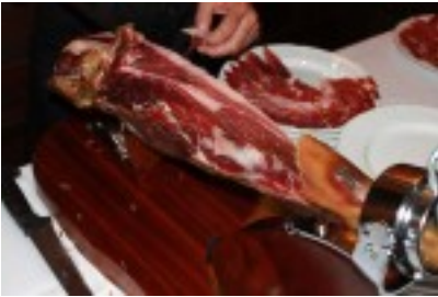
Pata de Jamón Ibérico cortado en sala

El Menú Eresma comienza con el Cóctel, que consta de estos 12 aperitivos: