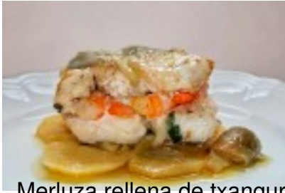
Merluza rellena de txangurro y gambas en salsa de cava