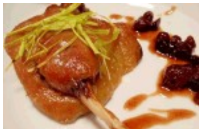
Confit de pato al aroma de moscatel y pasas con puré reinetas