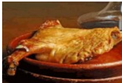
Lechazo asado con ensalada