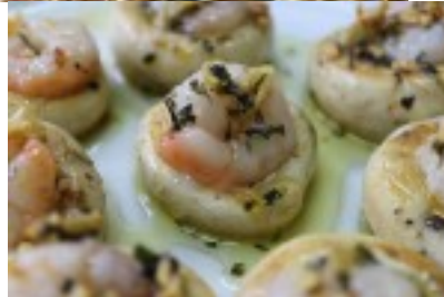
Coronas de champiñón con gambas