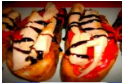
Tosta de pimientos asados con ventresca