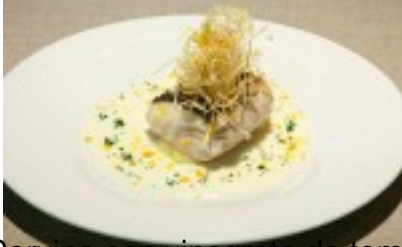
Corymba con vinagreta de tomate a la trufa y crujiente de puerro