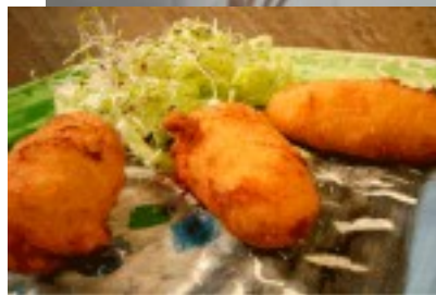
Croquetas caseras de boletus