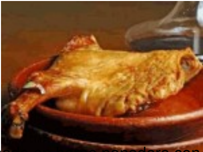
Lechazo asado en horno panadero con ensalada