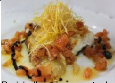
Rodaballo con vinagreta de tomate, trufa y crujiente de puerro

En el menú se han incluido los siguientes platos: platos de entrada, platos principales, platos de acompañamiento, platos de postre, platos de bebida y platos de postre.