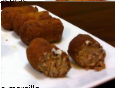
Bolitas de morcilla