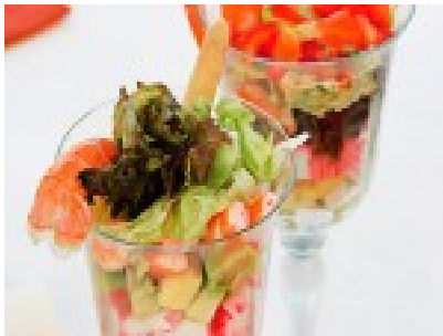
Mini cóctel de marisco