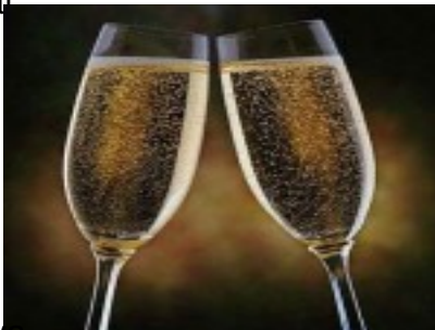
Copa de cava