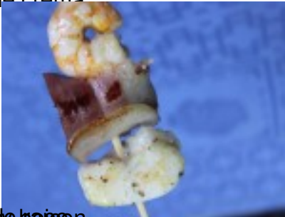
Langostinos y cebollitas