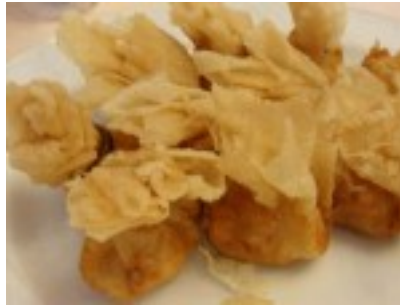
Saquitos crujientes de picadillo y huevo