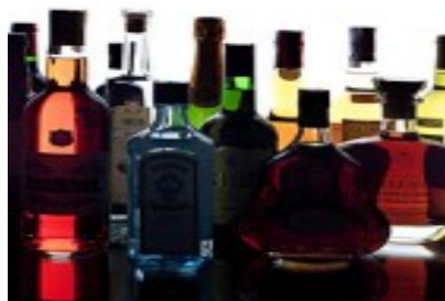
Café y licores