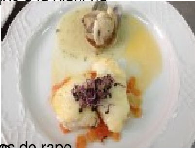
Medallitas de rabe