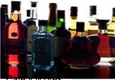
Café y licores