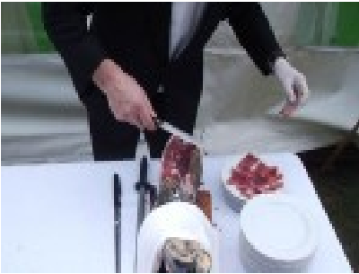
Jamón Iberico de Bellota D.O. Dehesa de Extremadura

El Menú La Bella Durmiente comienza con el Cóctel, que consta de estos 11 aperitivos: