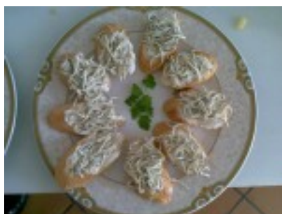
Tosta de gulas sobre cama de ali - oli