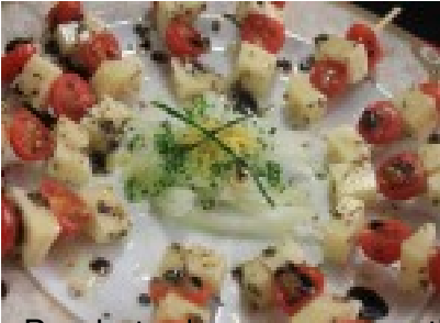
Prueba de mesa aromatizada con alioli de aversede, de presentación de la Orca, Pisco del Real de la casa, bandeja de spiritos estivos, platos a compresados del sorbete, la tarta