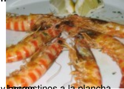
y langostinos a la plancha