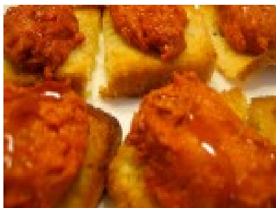
Tosta de sobrasada y miel