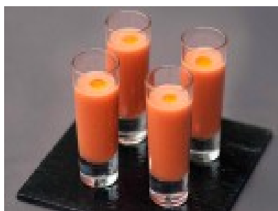
Chupitos de gazpacho