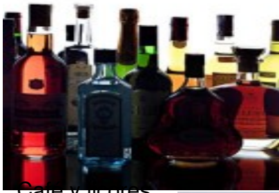
Café y licores