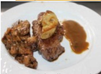
Solomillo de ternera de aliste con foie, setas y hongos