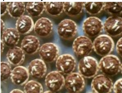
Volován de morcilla de Burgos con piñones