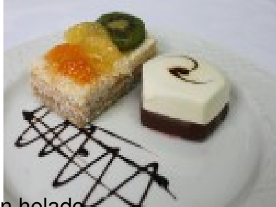
Tarta nupcial con helado