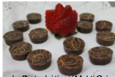
Bombones de chocolate y fresa. Cordon Rojo, refresco de la mitificación del Oriente. Pisco del Social. Liqueur de los espíritus estivos, el plato sazonado del sorbete, la tarta