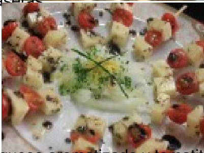
Brocheta de queso aromatizado y tomatito cherry