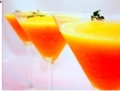
Sorbete de naranja