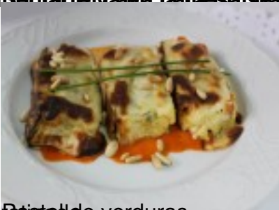
Paleta de verduras