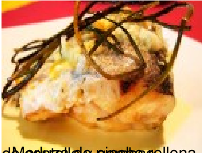
Medallón de paletas sellena